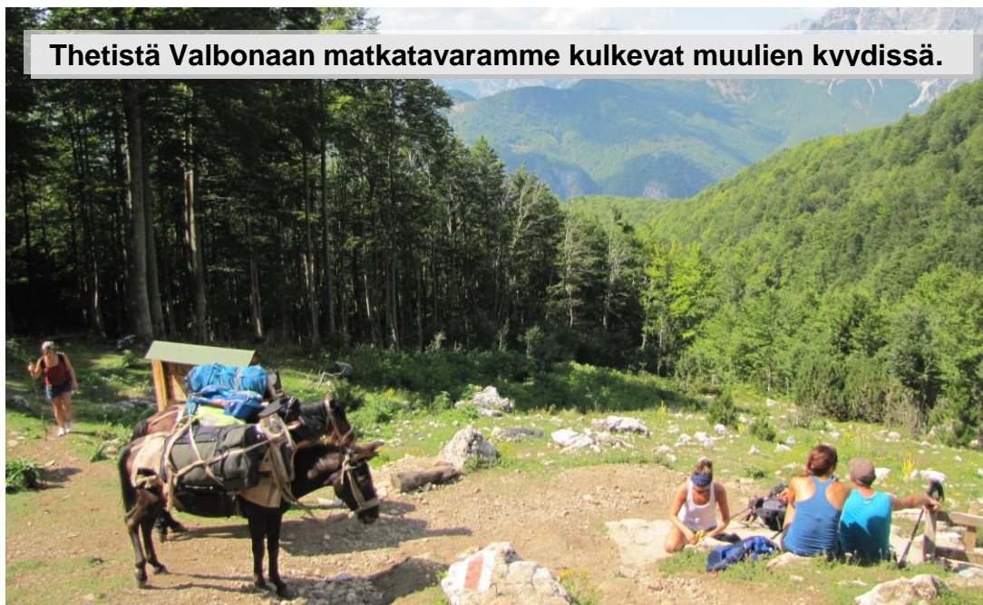
Thetistä Valbonaan matkatavaramme kulkevat muulien kvvdissä.

Vaelluspäivien retkievää t otetaan mukaan majatalosta.