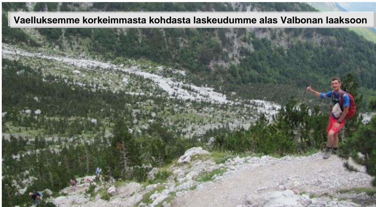
Vaelluksemme korkeimmasta kohdasta laskeudumme alas Valbonan laaksoon

Vaelluskenkien on oltava nilkkaa hyvin tukevat ja niissä on oltava voimakas pohjakuviointi. Voimakas pohjakuviointi tarkoittaa sitä, että kengällä saa hyvän pidon kivisesä ja irtonaisessa maastossa. Tärkeää on kengän istuvuus jalkaan. Ei ole tarpeen hankkia huippukalliita vuorikiipeilykenkiä, sillä hyviä ja toimivia vaelluskenkiä saa ihan kohtuuhintaan. Muista käyttää kenkiä mahdollisimman paljon ennen matkaa (ns. hyvin sisäänajetut). Uudet käyttämättömät kengät aiheuttavat vuorenvarmasti hiertymiä. Hyvien kenkien lisäksi on hyvä olla mukavat sukat. Vaellussukat tai muut nopeasti kuivuvaa materiaalia olevat urheilusukat ovat parhaat. Ohuet liner-alussukat vähentävät hiertymien mahdollisuutta (kahdet sukat päällekkäin).